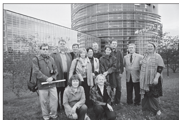
Lutherische Redakteurinnen und Redakteure aus neun europäischen Minderheitskirchen bei einem Arbeitstreffen in Straßburg.

Die meisten Exemplare der Kirchlichen Blätter gehen in die Bezirke der Landeskirche und gelangen über die Pfarrämter