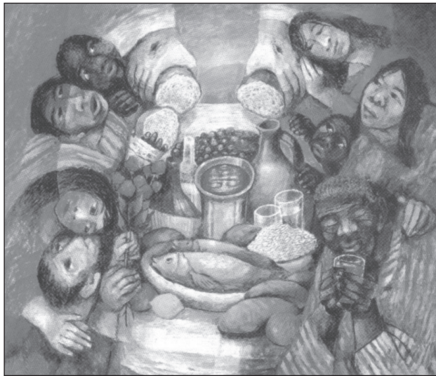
Das Mahl. Von Sieger Köder, Misereor-Hungertuch »Hoffnung den Ausgegrenzten«.

Sicher kann auch diesen Satz niemand bestreiten! Und nicht wenige in unserer Welt leben in der Meinung: Wenn wir Essen und Trinken haben, haben wir das Leben! Wer aber einmal im Krankenhaus durch die Abteilung der Magen- und Darmkran-