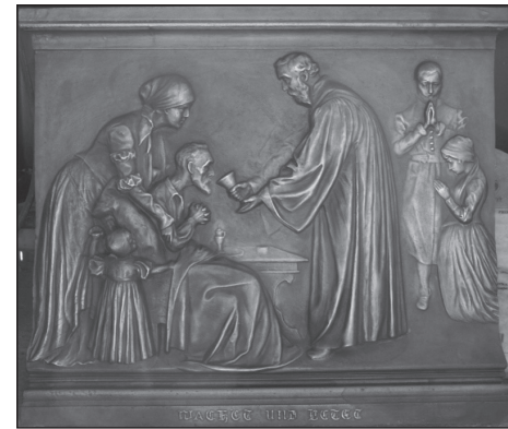
Sockelrelief: Honterus, der Seelsorger.

Die beiden Sockelreliefs zeigen den Reformator Johannes Honterus als Buchdrucker und Seelsorger. kbl