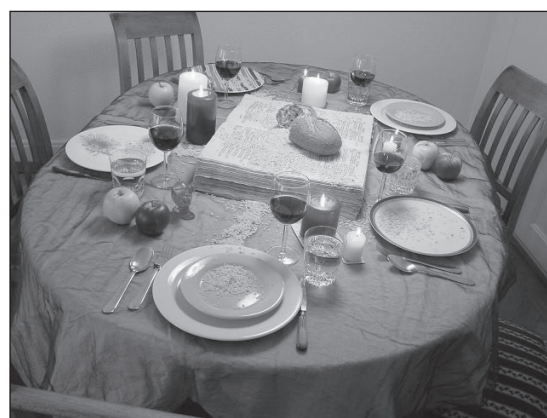
»Familientsch Gottes« Installation von Philipp Kohli

(Aus: Salzkorn. Anstiftung zum gemeinsamen Christenleben . 1/2008. Nr. 232. Seite 34–35)