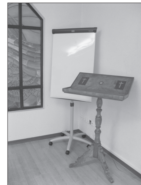
»Flipchart« und Lesepult: jüngere und ältere Hilfsmittel der Kommunikation.

(Entwurf der Arbeitsgruppe »Kommunikation und Öffentlichkeitsarbeit«, Redaktion G.R.)